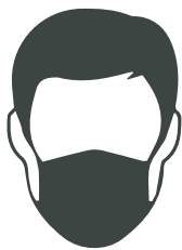
Mascarilla FFP2 UNE EN 149

Utiliza tus EPI (Equipo de Protección Individual) una sola vez. SON DESECHABLES.