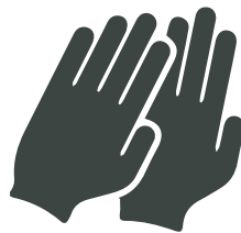
Guantes UNE EN 374